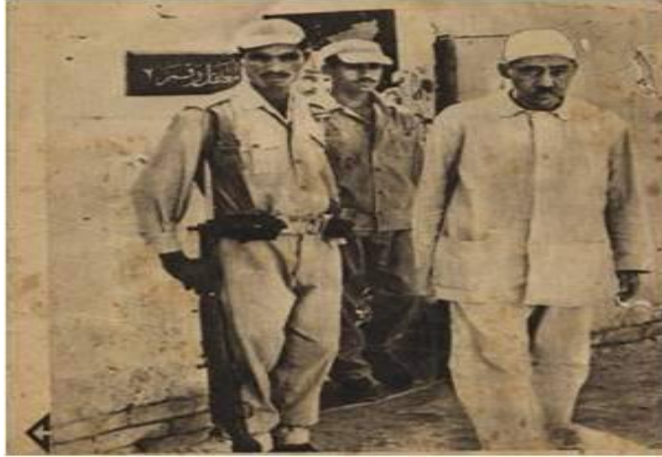
الأستاذ/ سيد قطب في المعتقل.